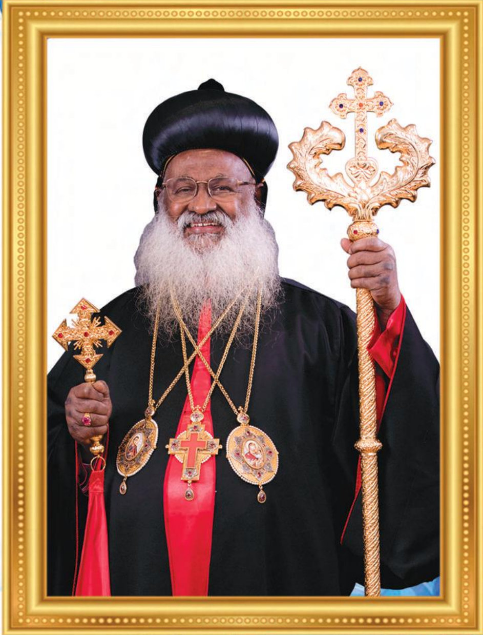
H.G. Baselius Marthoma Mathews III Catholicos of the East & Malankara Metropolitan