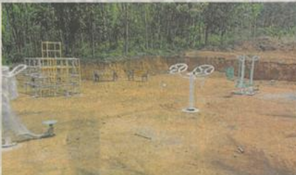
പാർക്ക് ഉദ്ഘാടനം നടത്തിയ ചിത്രം. മോസം സെന്ററിൽ ആരോഗ്യ പാർക്ക് നിർമ്മാണത്തിന് ഉദ്ഘാടനം നടത്തി.

പാർക്ക് പദ്ധതിയുടെ ഭാഗമായി സഭ കോട്ടയം ക്ലാസ്സറൽ ആരോഗ്യകേന്ദ്രത്തിൽ പ്രവർത്തിക്കുന്ന പാർക്ക് നിർമ്മാണത്തിന് ഉദ്ഘാടനം നടത്തി. മോസം സെന്ററിൽ ആരോഗ്യ പാർക്ക് നിർമ്മാണത്തിന് ഉദ്ഘാടനം നടത്തി. മോസം സെന്ററിൽ ആരോഗ്യ പാർക്ക് നിർമ്മാണത്തിന് ഉദ്ഘാടനം നടത്തി.